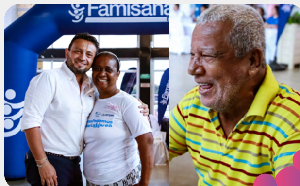
Cartagena, Bolívar 26/09/2024