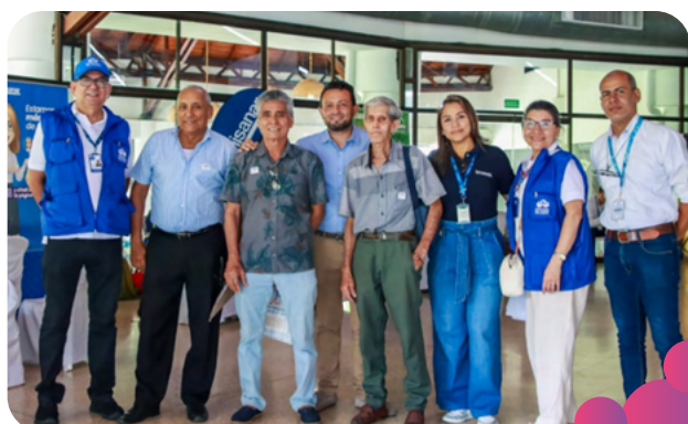
Santa Marta, Magdalena 28/09/2024