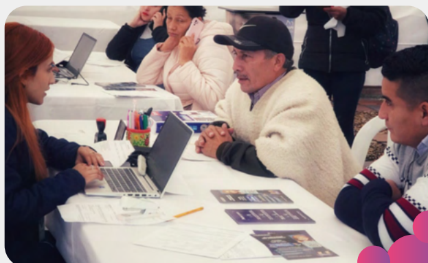
Chocontá, Cundinamarca 03/08/2024