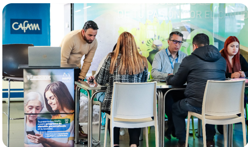
Banco Agrario 18/09/2024