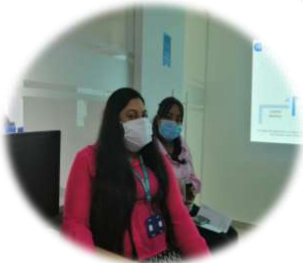
Ejecutiva de Contratación y Profesional De salud pública.