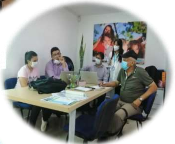
Coordinador Médico, Líder de Oficina Presidente Asufamisanar, analista PQR Y Directora Comercial