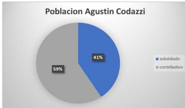
Ilustración 1. Población municipio de Agustín Codazzi a diciembre 2020. EPS Famisanar