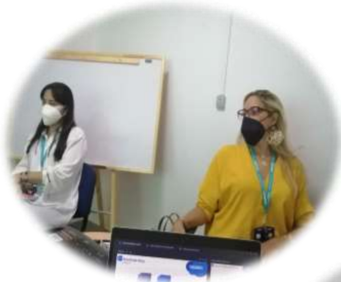
Gerente zonal y Directora comercial