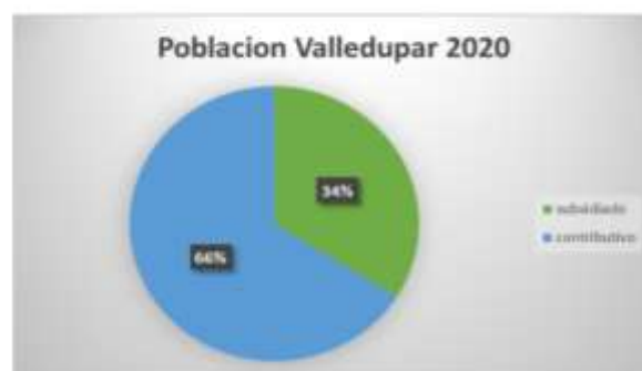
Ilustración 1. Población Municipio de Valledupar a diciembre 2020. EPS Famisanar