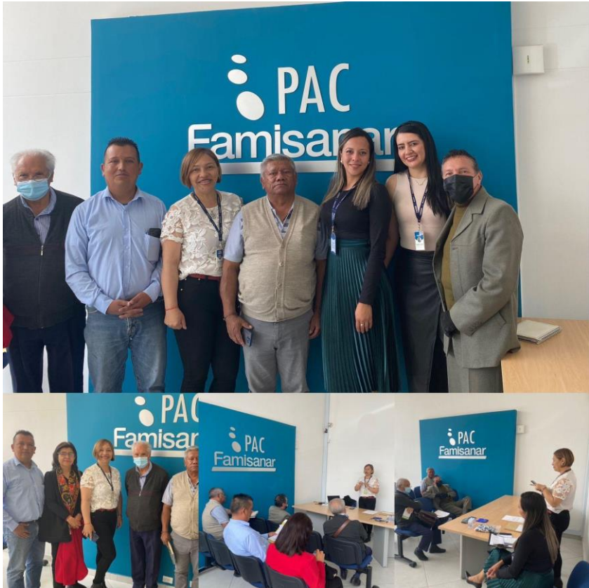
Junta Directiva Asufamisanar Duitama